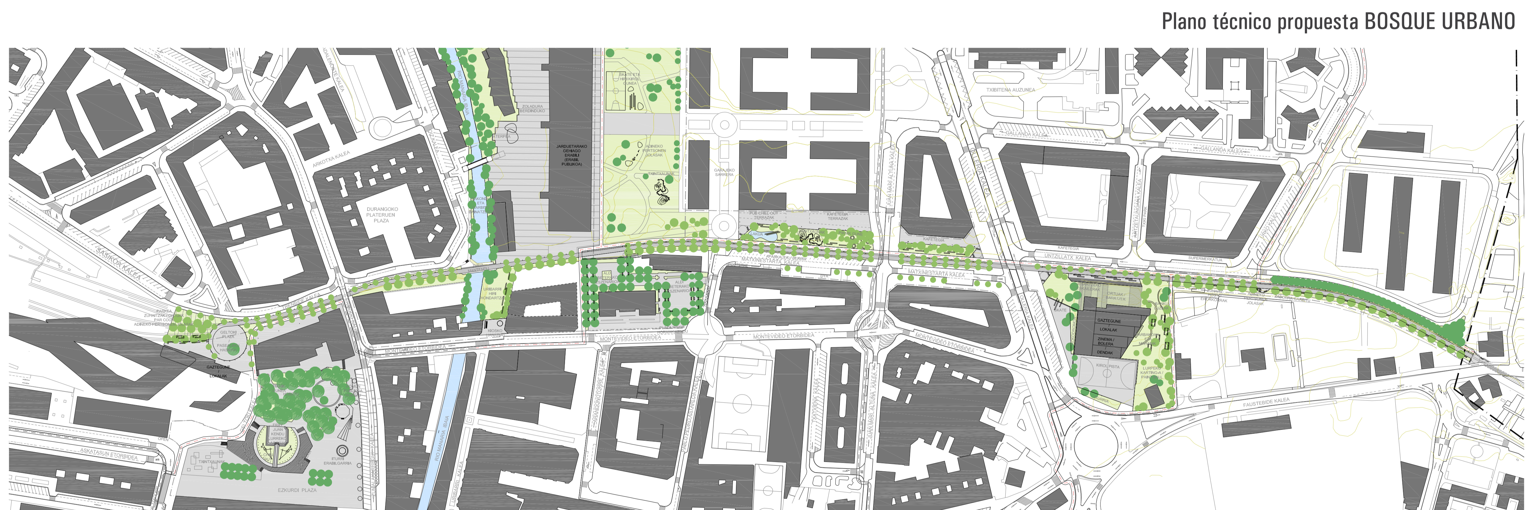
Plano técnico propuesta BOSQUE URBANO

A nivel pedagógico, cara al alumnado participante, el proceso permitió, a través de un proyecto real con unas necesidades concretas, introducir el conocimiento y la comprensión de la ciudad y sus distintos componentes, bajo el prisma de la sostenibilidad urbana.