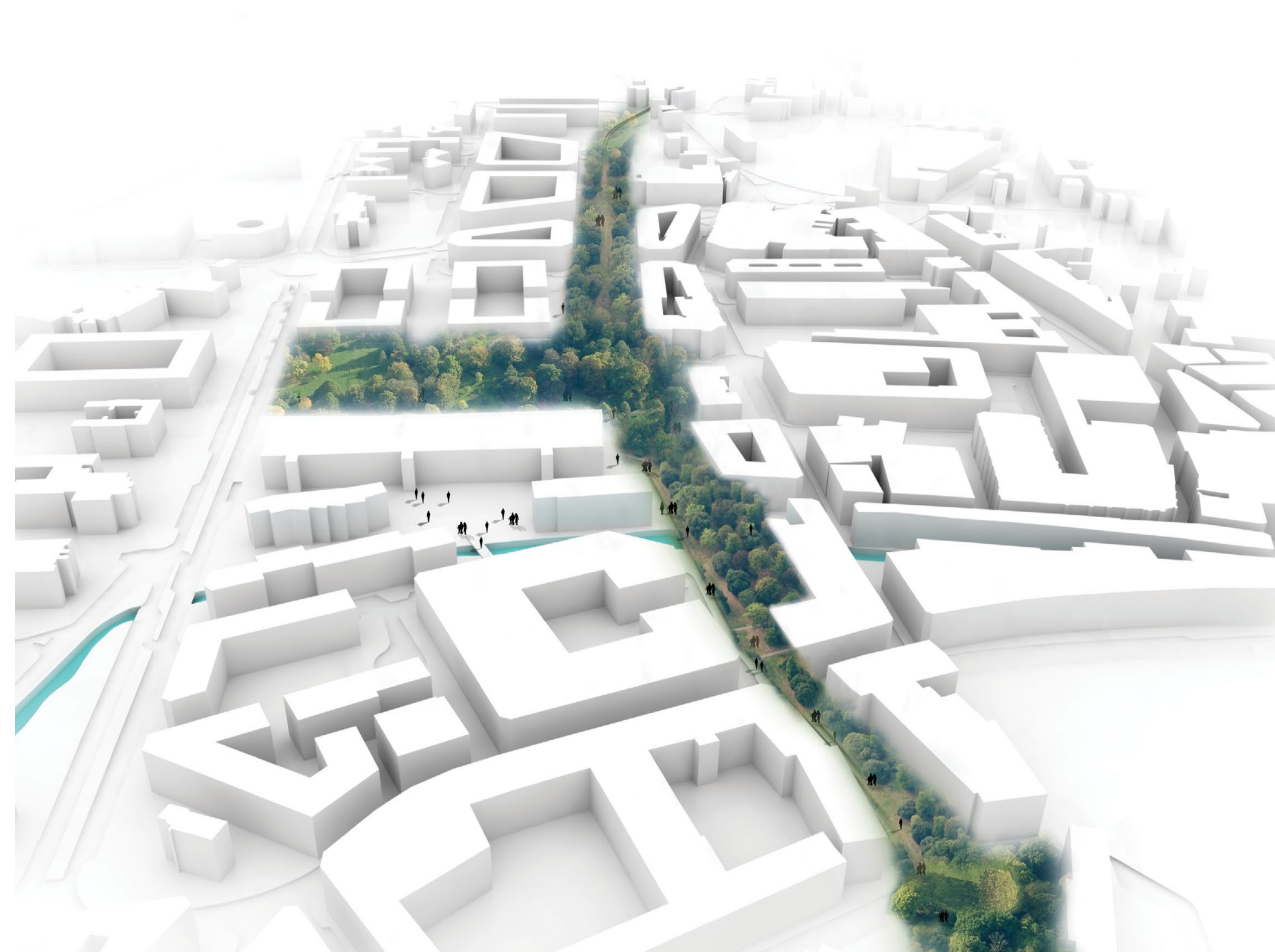
Vista aérea BOSQUE URBANO