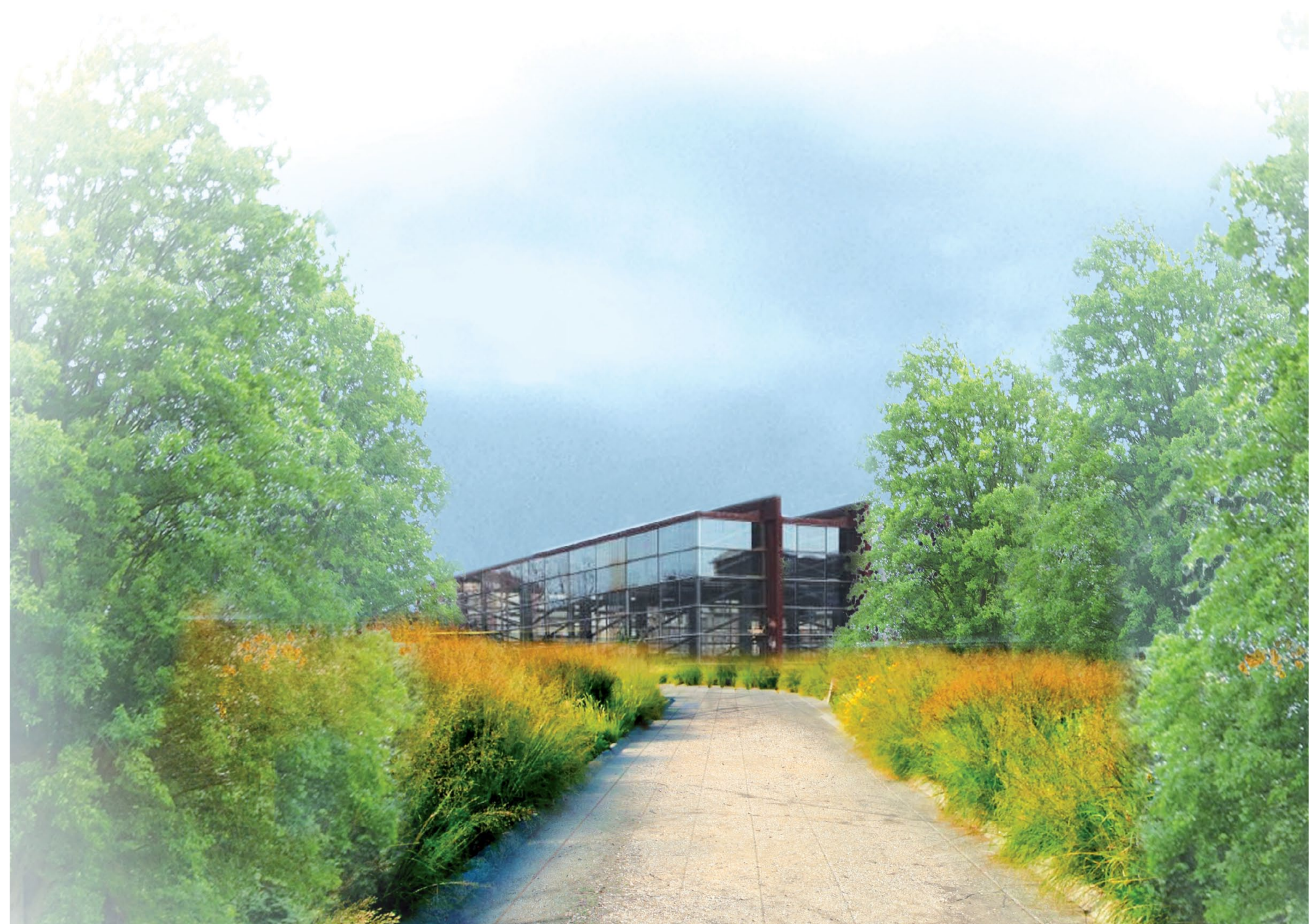
Vista desde el interior del BOSQUE URBANO hacia LANDAKO GUNEA, espacio multiusos municipal